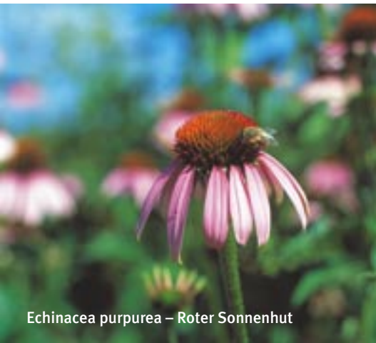
Echinacea purpurea – Roter Sonnenhut