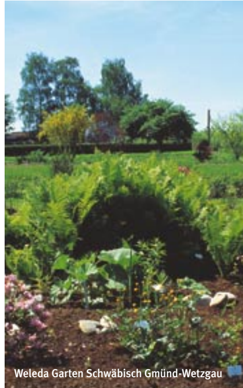
Weleda Garten Schwäbisch Gmünd-Wetzgau

Wir wünschen Ihnen viel Freude und ahnungsvolle Momente beim Betrachten der Bilder und Lesen der Texte – in der Hoffnung, dass Ihr Bild vom Unternehmen Weleda dadurch noch farbiger wird.