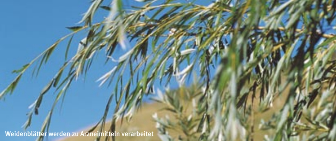
Weidenblätter werden zu Arzneimitteln verarbeitet