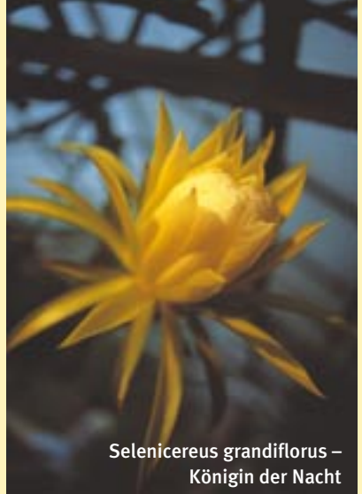
Selenicereus grandiflorus – Königin der Nacht