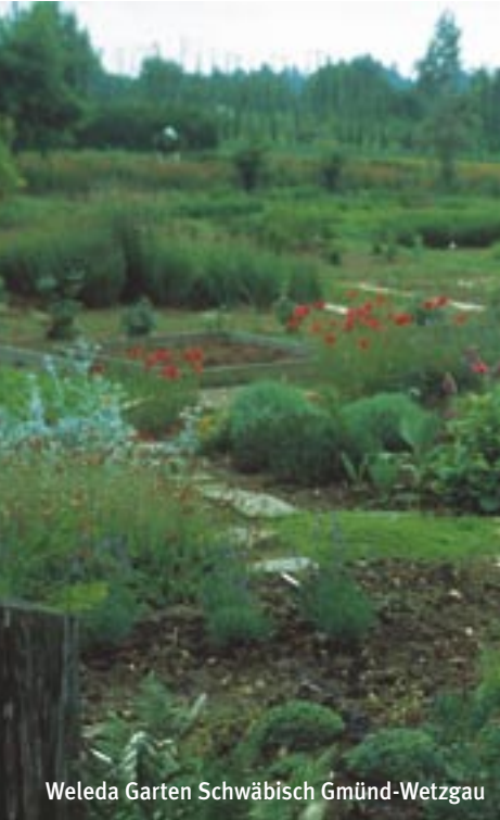
Weleda Garten Schwäbisch Gmünd-Wetzgau

G ärten sind Orte der Sehnsucht. Viele Ursprungslegenden der Menschheit ranken sich um sie. »Paradies«, das Wort aus dem Altpersischen, bedeutet nichts anderes als »Prachtgarten«. In Gärten kommen wir zur Ruhe. In Gärten erholen wir uns. In den Gärten wächst, was uns nährt und ganz macht.