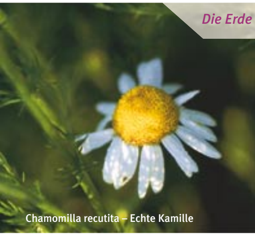
Chamomilla recutita – Echte Kamille