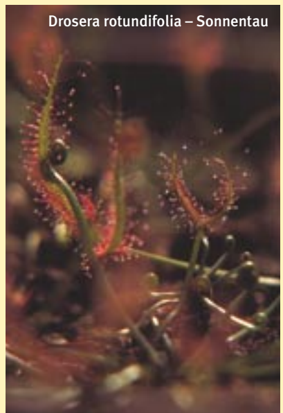
Drosera rotundifolia – Sonnentau

Einer der zentralen Punkte im Schaugarten der Weleda Schwäbisch Gmünd ist das Glashaus. Hier finden wir vorwiegend Pflanzen aus tropischen und subtropischen Gebieten: Königin der Nacht, Sonnentau oder Seidenblume heißen die weniger bekannten unter ihnen – Kaffee, Ingwer oder Erdnuss heißen die prominenten. Im Glashaus haben unsere Besucher die Gelegenheit, auch diese exotischen Pflanzen über die unmittelbare Anschauung besser zu begreifen.