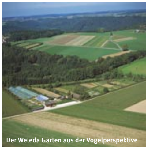
Der Weleda Garten aus der Vogelperspektive

Selbst unter Naturschutz stehende Pflanzen wie etwa Hirschzungenfarn oder Gelber Enzian gedeihen hier. Jedes Jahr wird im Weleda Heilpflanzengarten mindestens eine Wildpflanze neu in Kultur genommen. Jüngstes Beispiel ist der Augentrost. Er wurzelt halbparasitisch auf Kräuter- und Graswurzeln. Ungedüngte Magerwiesen bilden seinen Lebensraum. Inzwischen ist die Pflanze jedoch wegen intensiver landwirtschaftlicher Nutzung bedroht. Was lag da näher, als den Augentrost im eigenen Heilpflanzengarten anzubauen und ihm eine neue Heimat zu geben? Womit zugleich der steigende Bedarf der Weleda zur Herstellung von Augentropfen und Augensalben gedeckt werden konnte.