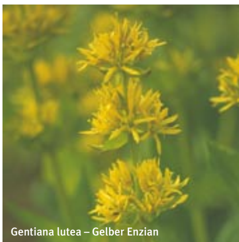
Gentiana lutea – Gelber Enzian