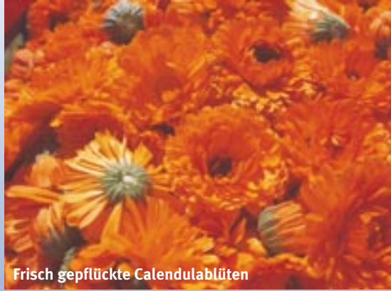
Frisch gepflückte Calendulablüten

Eine der wichtigsten Pflanzen ist die Calendula, die Ringelblume. Man nennt sie auch »Braut der Sonne« wegen ihrer orange leuchtenden Blüten. Sowohl im Bereich der arzneilichen Anwendungen wie in der Körperpflege zeigen sich ihre harmonisierenden und heilenden Eigenschaften in einer Vielzahl von Zubereitungen. Doch bis die Calendula ihre Heilkraft vermitteln kann, ist viel sorgfältige Pflege und Arbeit nötig. Die beginnt bereits bei der Auswahl des eigenen biologisch-dynamischen Saatguts, denn Weleda betreibt beim