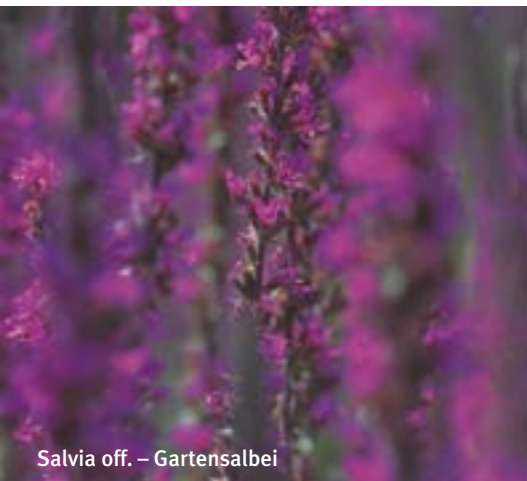
Salvia off. – Gartensalbei