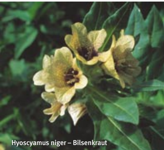
Hyoscyamus niger – Bilsenkraut